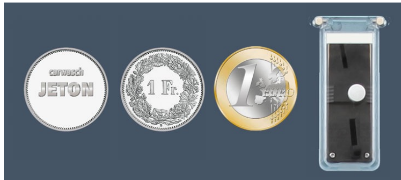
Jeton oder Bargeld